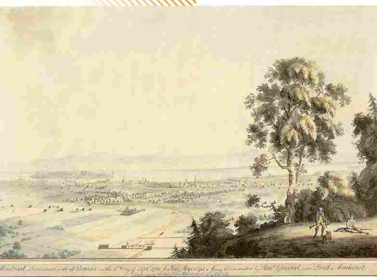
Montréal. Vue du Mont Royal, 1784

n'être, dans ces cas-ci, qu'un nom de ville plus facile à situer, à l'étranger et outre-mer, que n'importe quel village du comté. La paroisse est parfois indiquée, mais c'est sans doute celle du dernier domicile et pas nécessairement celle du baptême. Enfin, il faut compter avec les déformations habituelles des noms de famille, mal prononcés, mal compris, mal écrits. Sur les rives du Saint-Laurent, Van den Dijk devient Vandandaïque... Point n'est besoin d'aller si loin, nos greffiers, nos notaires du 18 e siècle faisaient de même. À l'historien d'exercer son flair et sa patience.